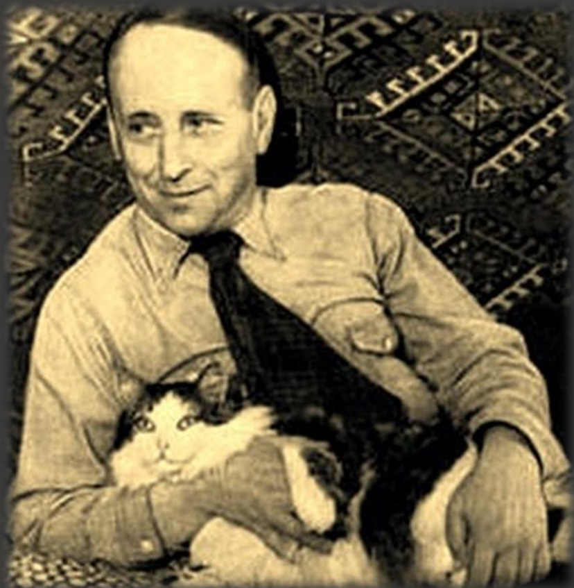
К юбилею Е. Шварца (120 лет со дня рождения)