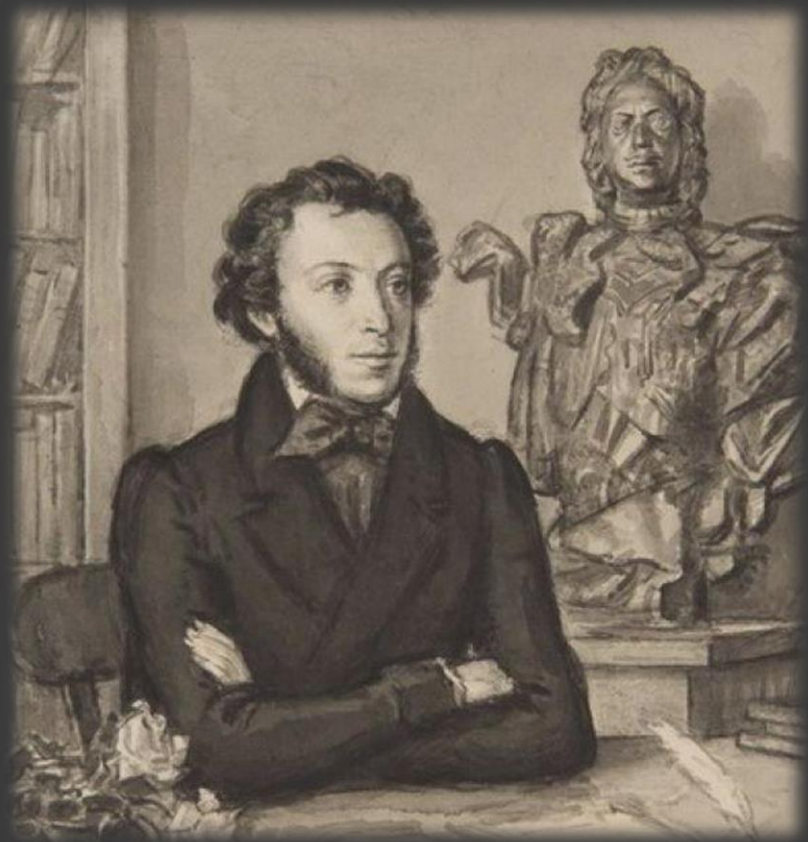
Ко дню памяти А.С. Пушкина (180 лет со дня гибели) спектакль «Барышня-крестьянка»